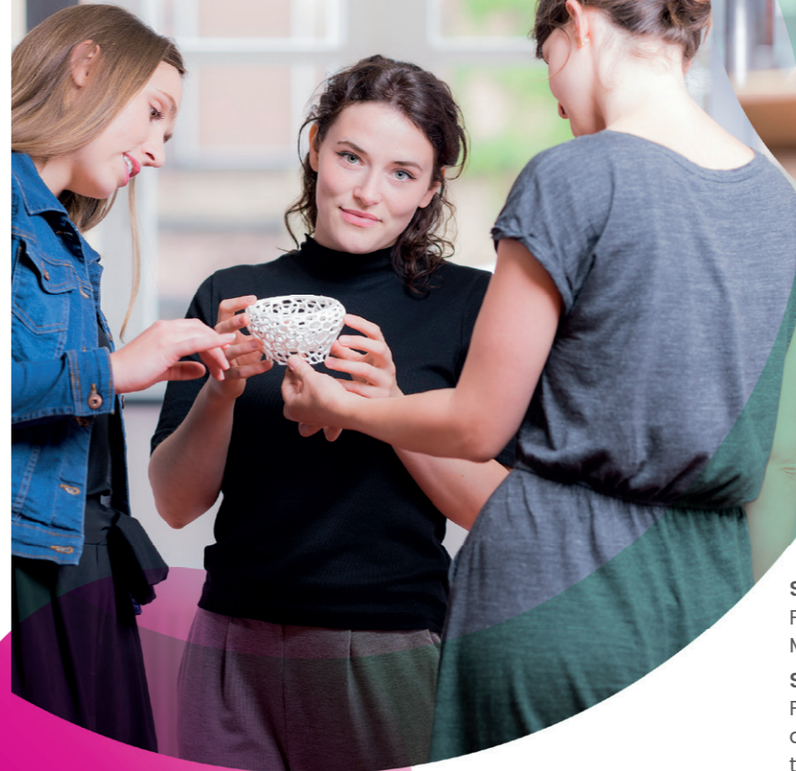
gedruckt auf Recyclingpapier